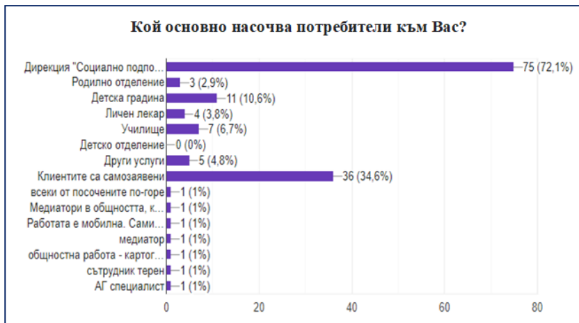
Фигура 2. Насочване на потребители

Резултатите показват най-висок дял според 72% от респондентите, посочващи „Дирекциите за социално подпомагане“ като водещи спрямо насочването на потребителите, следвани от 34,6% дял на клиенти, които са самозаявени. По отношение на дела на самозаявените потребители, който се посочва от анкетираните, стойността е сравнително висока и това е важен показател по отношение на идентифицирането на потребностите от самите потребители и възможностите да получат достъп до услуги, консултации и подкрепа по тяхна инициатива. Според 10,6% от анкетираните специалисти потребителите, които ползват предоставяните от тях услуги, са насочвани от детски градини, следвани от насочващи ги училища според 6,7% от специалистите. Следващите данни показват значително по-малък процент – 4,8%, определен от участниците в изследването, които посочват „другите услуги“ като насочващи. По отношение на медицинските специалисти малък процент – 3,8%, от участниците поставят на едно от последните места личните лекари като активни при насочването на потребителите, а напълно отсъстващи според участниците при насочването на потребители към социалните услуги са детските отделения.