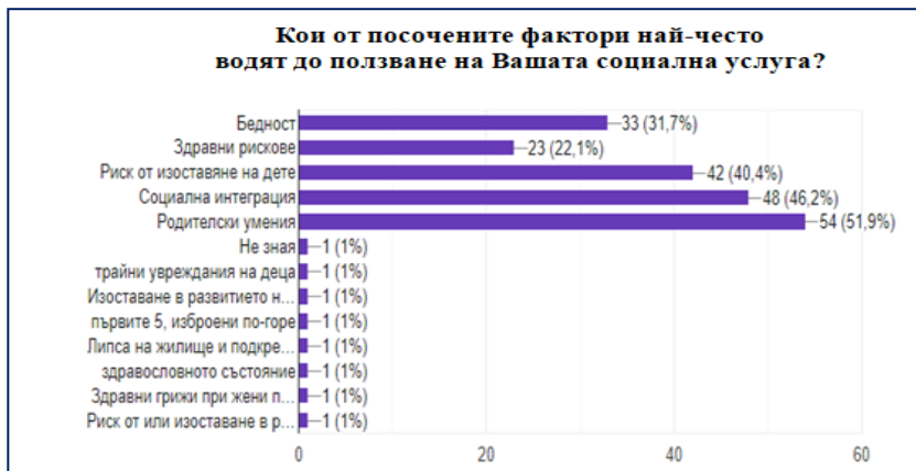
Фигура 1. Фактори за ползване на услуги

Данните показват, че най-честият фактор, който води потребителите до ползването на социалната услуга, е „родителски умения“ и е над средното ниво с 51,9%, следван от фактор „социална интеграция“ с 46,2%, фактор „риск от изоставяне“ – 40,4%, фактор „бедност“ – 31,7%, и на последно място като фактор е посочен „здравен риск“ с 22,1%. Представените резултати отчитат най-висок резултат на фактора „родителски умения“ спрямо другите, които са посочени като възможности. Това показва значението на възможностите и формите за подкрепа на семейството, които следва да са налични като набор от дейности. Следващият фактор се свързва със социалната интеграция на децата и семействата както по отношение на рисковете за тях, така и по отношение на подкрепата на средата и общността.